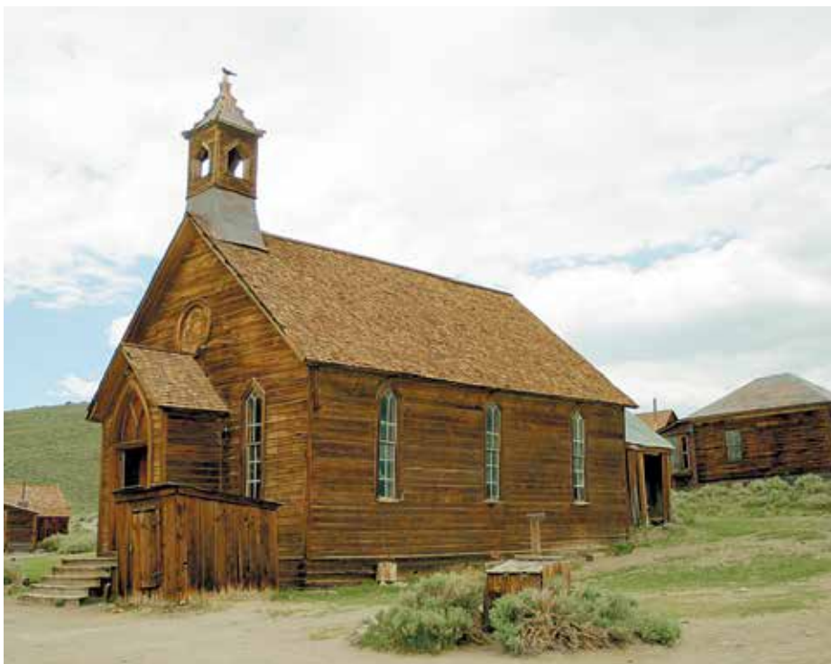
Iglesia Metodista en la esquina de las calles Green y Fuller

La accesibilidad se mejora continuamente. Para conocer mejor los detalles de accesibilidad, comuníquese con el parque o visite http://access.parks.ca.gov .