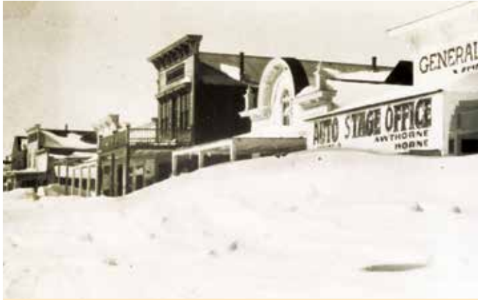
Bodie en invierno circa – c.1920s