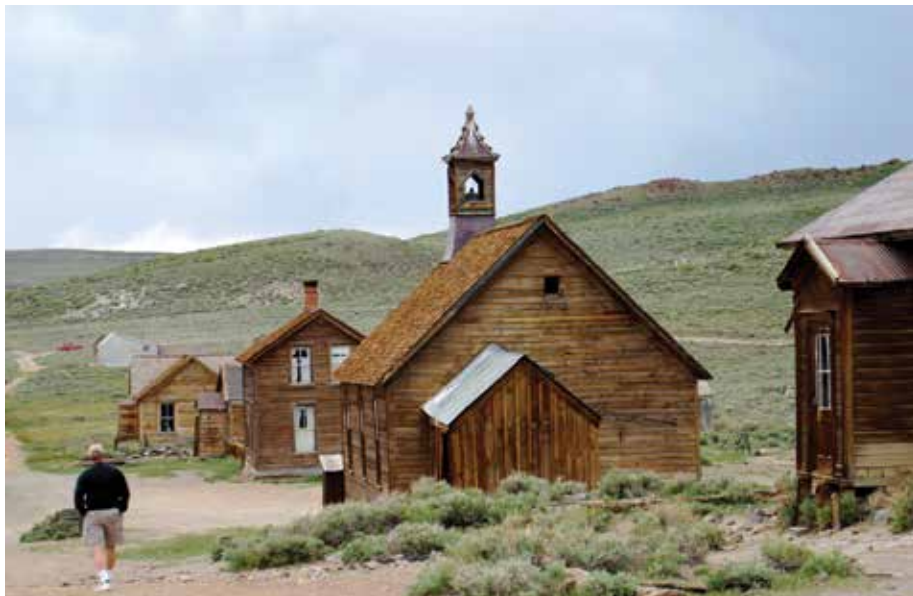
Un visitante examina algunos de los edificios históricos del parque.

Con una población de varios cientos de personas, los chinos crearon un barrio dentro del mismo pueblo con el objetivo de mantener sus costumbres y tradiciones y porque, además, no eran miembros bienvenidos dentro de la sociedad de blancos. Ubicado a lo largo de la calle King, el barrio chino contaba con almacenes de ramos generales, lavanderías, pensiones, salas de juegos, cantinas y un templo taoísta. Los chinos también ganaban dinero mediante la venta de vegetales, haciendo carbón y trabajando en el ferrocarril de Bodie.