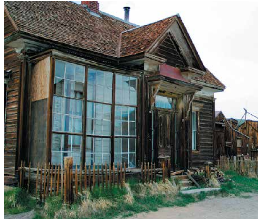
Residencia J. S. Cain

se aprobara la Ley de Protección de Bodie (Bodie Protection Act) de 1994. La legislación anuló el derecho a reclamar concesiones por nuevas patentes o por minerales sobre las tierras del Distrito de Bodie y abrió el camino para que California State Parks le comprara las concesiones mineras a la compañía canadiense, ahora en bancarota, preservando así, este tesoro californiano de características únicas.