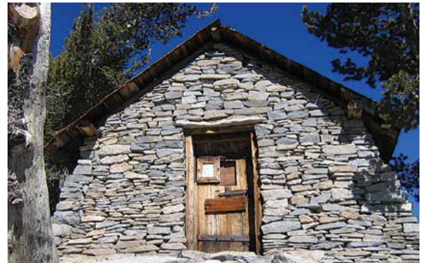
Refugio de emergencia construido por el Cuerpo Civil de Conservación ubicado debajo del Pico San Jacinto.

Para acampar los fines de semana en uno de los cuatro campamentos estatales del área silvestre se debe obtener un permiso con antelación. Las solicitudes de permiso para el Parque Estatal de Vida Silvestre Monte San Jacinto están disponibles en www.parks.ca.gov/msjsp . Realice los trámites con al menos dos semanas antes de su visita para que se emitan y se le entreguen los permisos. Para obtener información sobre el campamento del USFS y los permisos, visite www.fs.usda.gov/sbnf .